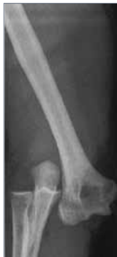
Abb. 17: luxiertes Ellenbogengelenk