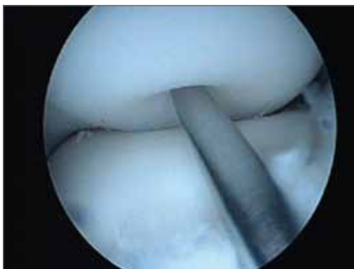
Abb. 8: Anbohrung des geschädigten Knorpel-Knochen-Areals

Die beste Prognose hat die Erkrankung, wenn sie frühzeitig erkannt wird. Durch eine Reduktion der Belastung und Schonung des Ellenbogens kann ein schmerzfreier Zustand erreicht und die Abstoßung des Knorpels verhindert werden. Sollte die Erkrankung jedoch erst in einem fortgeschrittenen Stadium mit (Teil-) Ablösung des Knorpels entdeckt werden, kann ein arthroskopischer Eingriff mit Anbohrungen des durchblutungsgestörten Bezirkes und einer entsprechenden Knorpeltherapie gute Ergebnisse erzielen (Abb. 8+9).