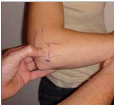
Abb. 1: radialer Epicondylus

Diese Diagnose beschreibt eher ein Symptom. Es handelt sich dabei um eine Schmerzangabe am radialen (außenseitigen) Epicondylus des Oberarms mit Ausstrahlung in die Unterarmstreckmuskeln (Abb. 1).