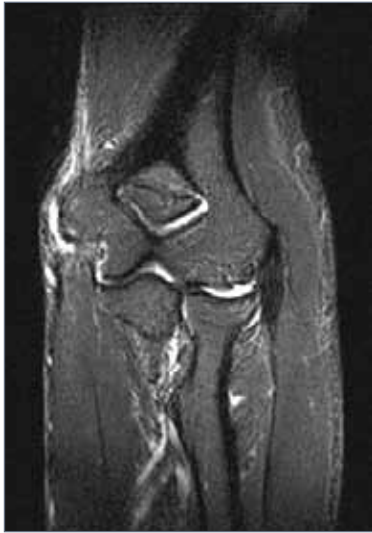
Abb. 5: Epicondylitis humeri ulnaris

Die schmerzhafte Ansatzentzündung der Unterarmbeugemuskeln am ulnaren (innenseitigen) Epicondylus (Abb. 2) ist trotz der gleichen konservativen Maßnahmen deutlich effektiver zu behandeln als der Tennisellenbogen. In der Regel handelt es sich bei dieser Erkrankung um eine Überlastung in der Ansatzzone der Unterarmbeuger.