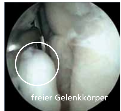
Abb. 7: Entfernung eines freien Gelenkkörpers

Um nicht nur die Beschwerden zu lindern, sondern auch den Erhalt des Gelenkes anzustreben, ist die Entfernung der freien Gelenkkörper durch einen arthroskopischen Eingriff (minimal-invasive Kamera-Technik) zu empfehlen. In gleicher Sitzung kann, falls möglich bzw. nötig, auch die Behandlung der Grunderkrankung erfolgen.