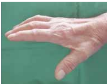
Abb. 6: Krallenhand

Nach einer Operation des ulnaren Nervs am Ellenbogen kann der Ellenbogen sofort bewegt werden. Eine Ruhigstellung ist nicht erforderlich. Je nach OP-Technik ist eine Schonung zwischen zwei und sechs Wochen erforderlich. Etwa sechs Monate nach der Nervenoperation sollte der Neurologe nochmals die Nervenleitgeschwindigkeit messen, um den Erfolg des operativen Eingriffs zu kontrollieren.