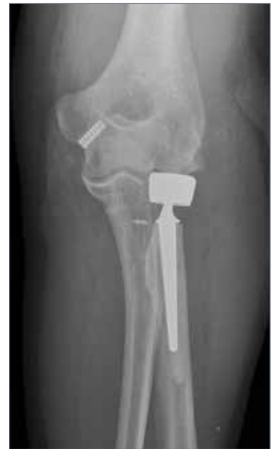
Abb. 15: Radiusköpfchenprothese nach posttraumatischer Arthrose