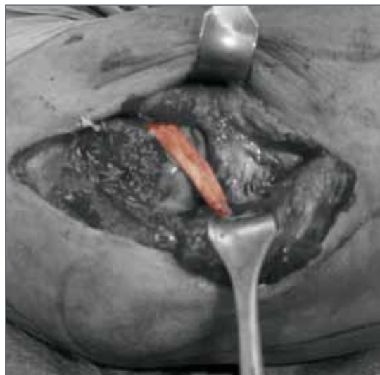
Abb. 4: eingesetztes Sehnentransplantat