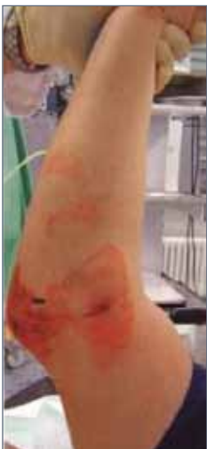
Abb. 16: Weichteilverletzung durch Luxation

Die Behandlung frischer, aber auch chronischer Verletzungsfolgen/Instabilitäten erfordert ein umfassendes Wissen und operatives Spektrum des behandelnden Arztes. Die Versorgungsweise solch komplexer Verletzungen verlangt meist eine individuelle Beurteilung.