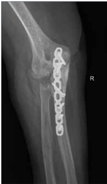
Abb. 13: Versuch der Gelenkerhaltung durch Osteosynthese

Haupteinsatz findet die Ellenbogenprothese vor allem bei der rheumatoiden Arthritis und posttraumatischen Zuständen.