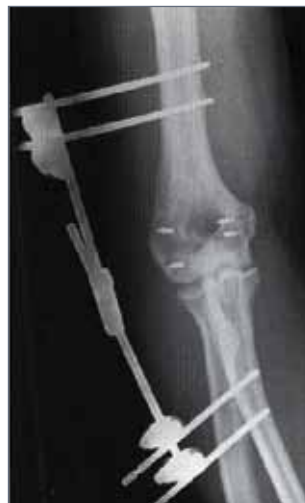
Abb. 18: Stabilisierung mit Fixateur externe und Rekonstruktion des Kapsel-Band-Apparates