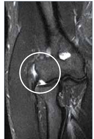
Abb. 2: Entzündungsödem am radialen epicondylus

Die operative Versorgung der chronischen Epicondylitis humeri radialis erfordert eine differenzierte Betrachtungsweise des gesamten Gelenkes und das erforderliche „know-how“ des Operateurs, um alle Ursachen der Schmerzsymptomatik verstehen und behandeln zu können.