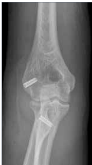
Abb. 3: Titanschraubenfixierung des Sehnentransplantates