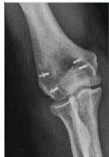
Abb. 19: nach Entfernung des externen Fixateurs (6 Wochen post-op)