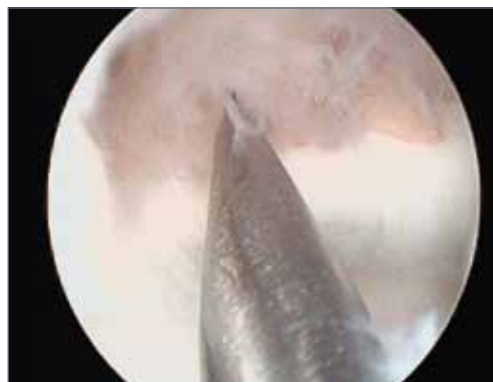
Abb. 9: Knorpeltherapie mit Microfrakturierung nach Entfernung des freien Knorpelstückes