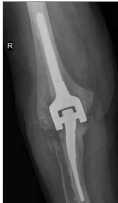
Abb. 14: Endoprothetischer Gelenkersatz mit einer sog. gekoppelten Prothese